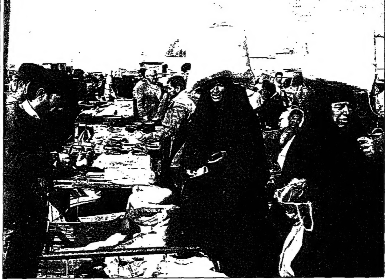
عراقيات في أحد أسواق بغداد

يبعد ان الصادق المهدي رئيس وزراء السودان الأسبق وضع نفسه في مواضع لا تليق به ومكانته، وبدأ يتخذ سلسلة من القرارات غير اللوفاة، منذ ان نجح في مغامرة الخرطوم متسللا، كان أخرها النهاب الى الكويت، والادلاء بتصريحات تهدف الى استرضاء حكومتها، ومحاولة كسب دعمها في مسيرته للعودة الى سدة الحكم في بلاده على أسنة رماع فرق، وبطريقة غير ديمقراطية، ظنا انتقد من استخدموها قبله.